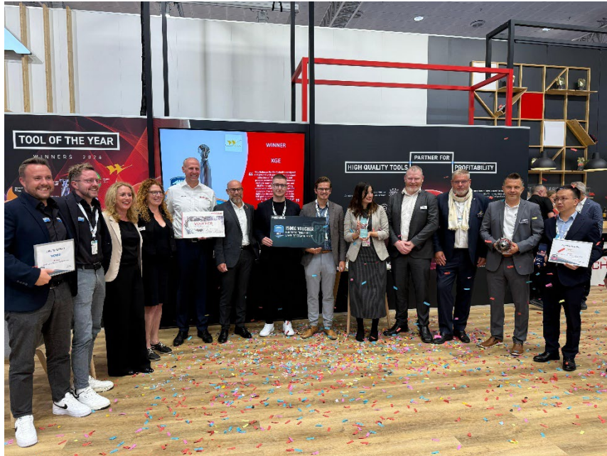
Alle Gewinnerinnen und Gewinner des Wettbewerbs auf einen Blick.